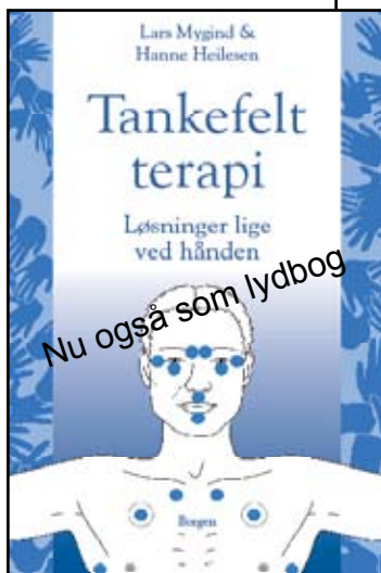
TFT bog og lydbog

Selv om TFT i kliniske forsøg har vist bemærkelsesværdige resultater er det en metode der fortsat befinder sig i udviklingsstadiet, hvor der ikke findes danske videnskabelige beviser for at metoden virker. Tankefeltterapi er derfor ikke en erstatning for at søge almindelig lægehjælp eller anden psykologisk hjælp.